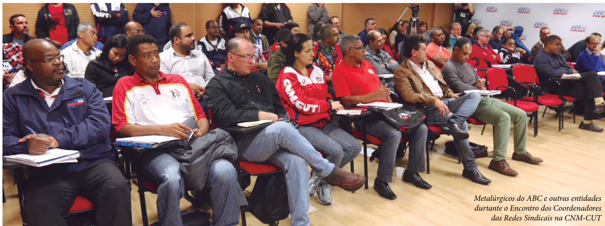
Metalúrgicos do ABC e outras entidades durante o Encontro dos Coordenadores das Redes Sindicais na CNM-CUT

Participaram da atividade cerca de 50 trabalhadores em empresas multinacionais do ramo metalúrgico, entre elas Ford, ZF, WEG, Volks, Toyota, entre outros.